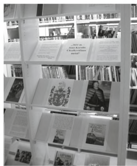
Rykantų biblioteka parengė parodą „2021 m. – Jono Karolio Chodkevičiaus metai“

Svarbiam mūšiu paminėti Lietuvos ir Ukrainos istorikai parengė bendrą gausiai iliustruotą leidinį „1621 m. Chotyno mūšis – mūšis dėl Vidurio Europos“, kuriame pateikta plati istoriografija, nušviestos susirėmimo aplinkybės, plačiai aprašyta lietuvių ir ukrainiečių karo vadų Jono Karolio Chodkevičiaus ir Petro Konaševičiaus-Sahaidačno reikšmė pergalei prieš daug pajėgesnį priešą pasiekti. Siekiant surinkti leidiniui iliustracijų, buvo surengtos ekspedicijos į dvidešimt keturias vieto-