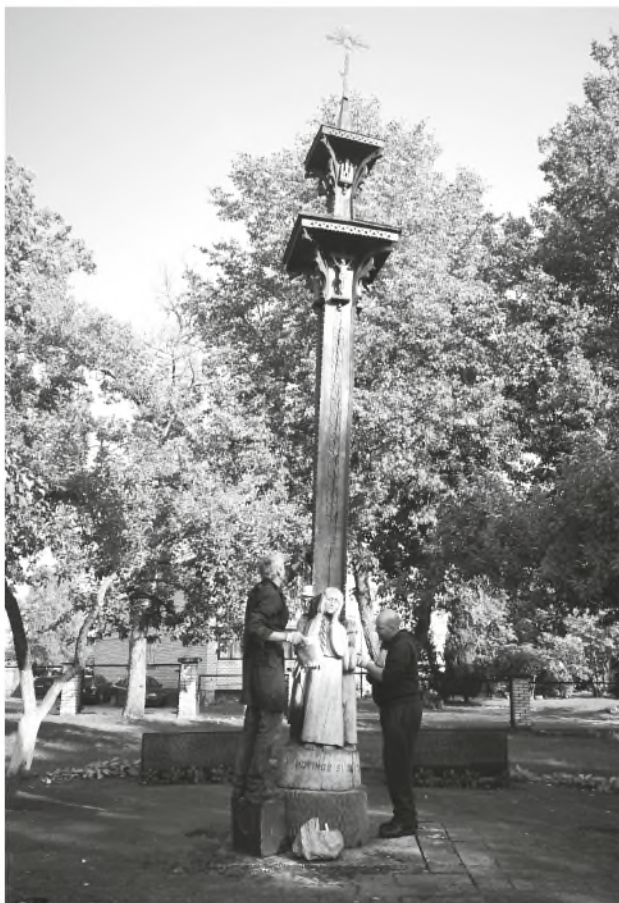
Koplytstulpis „Atžalyno“ gimnazijos kieme