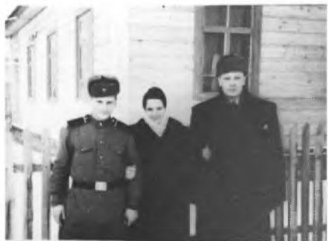
Mockaičių šeima su giminaičiu, tarnaujančiu sovietų armijoje 1955 m.

Traukinys pirmą kartą sustojo Rusijoje – Velikije Luky stotyje. Vandens nedavė, tik leido atsidadyti langelį. Ant rą kartą sustojo kažkur laukuose, kur buvo daug pelkių. Iš vagono išleisdavo po du žmones (iš pelkių) pasisemti vandens. Vėlesnėse stotyse pradėjo duoti košės, kurios nebuvo įmanoma valgyti.