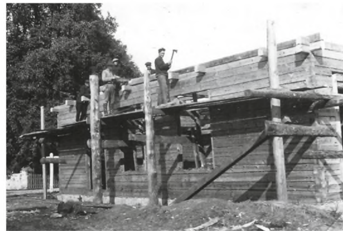
Nedzingės šaulių namų statyba. 1936 m. vasara.

1937 m. rugpjūčio 30 d. Nedzingės šaulių būrio taryba nutarė siū-