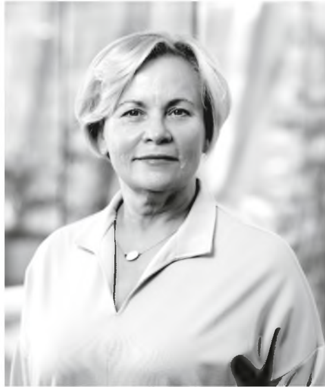
Rasa Juknevičienė – Europos Parlamento narė, EP grupės „Europos Atminčiai“ koordinatore

Iš pradžių buvau labai nustebusi, kad visas Kremliaus puolimas prieš