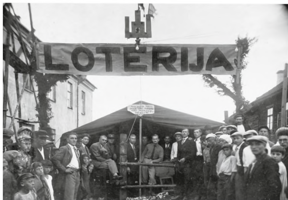
Renkamos lėšos Merkinės šaulių namų statybai. Merkinė, 1937 m.