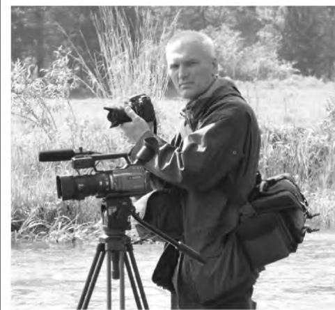
Fotografas Gintautas Alekna

Gintautas Alekna – tai tremties vietų metraštininkas, fotografas, tremties juostų kūrėjas. Tad kelios eilutės iš Gintauto biografijos.