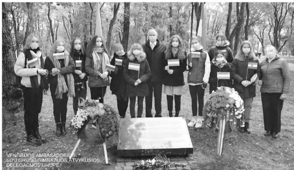
Vengrijos ambasadorius su Kauno Juozo Grušo meno gimnazijos moksleiviais