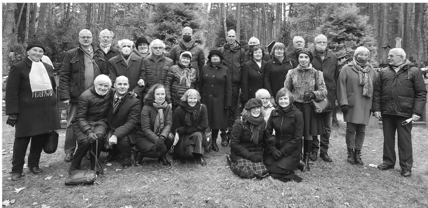
Kauno filialo tremtiniai Tautos kančių memoriale, Petrašiūnuose

Visų Šventųjų diena ir Vėlinės – tai laikas, kai mintimis ir darbais pagerbėme visus išėjusiuosius, bet amžiams likusius mūsų širdyse. Lankydami artimųjų kapus, neužmiršome atiduoti pagarbos ir tiems mirusiesiems, kurių kapų niekas nebelanko. Kai ant apleisto kapo pleveno liepsnelė, akimirka galėjome pasijausti nors lašelį geresni ir tauresni.