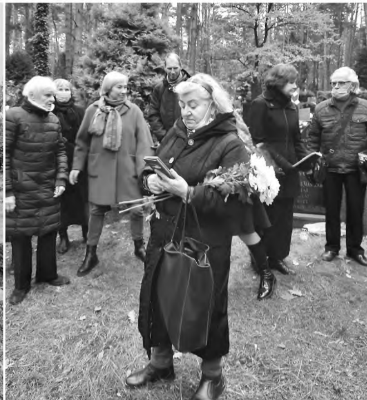
Tremtinių memoriale, Petrašiūnuose, norintieji skaitė eiles