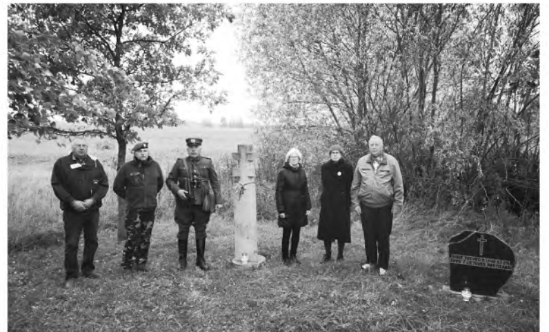
Šioje sodybvietėje žuvo septyni partizanai