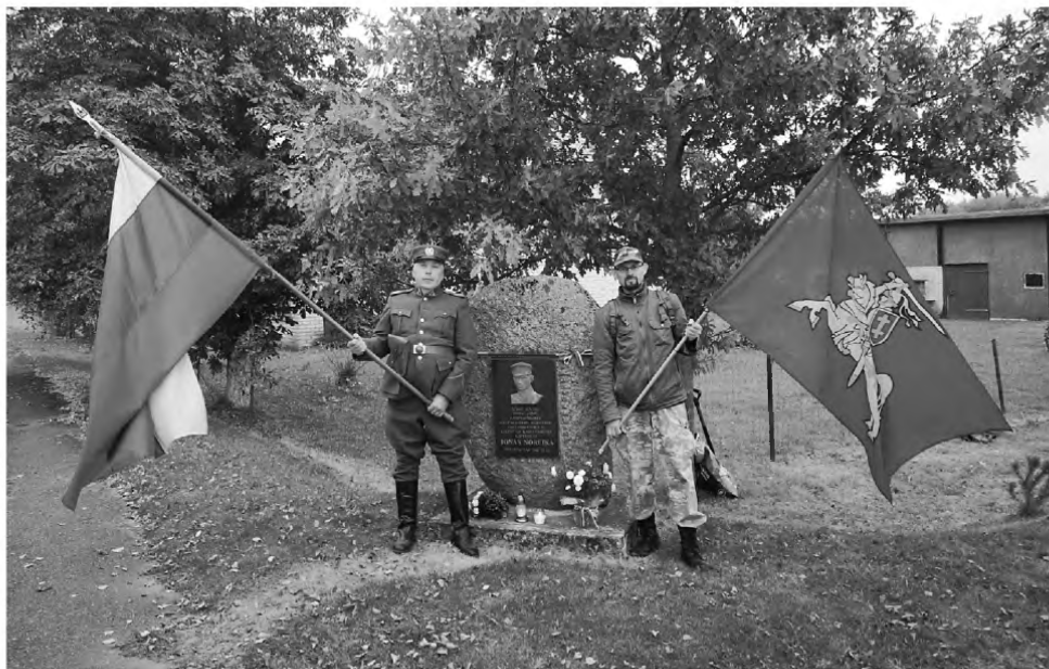
Prie Generolo Vėtros paminklinio akmens