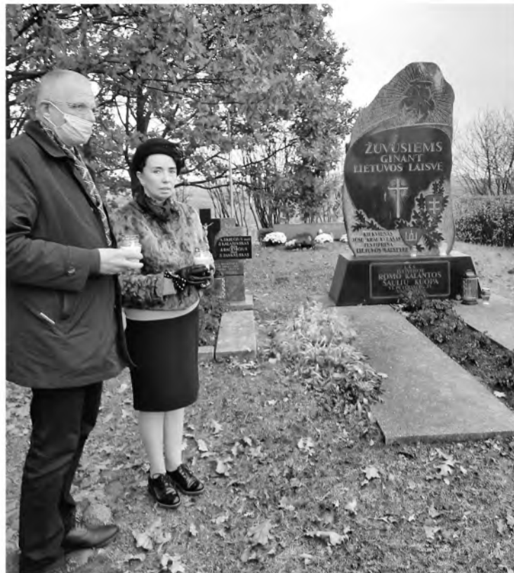
Atminimo žvakės Veiveriuose, Skausmo kalnelyje