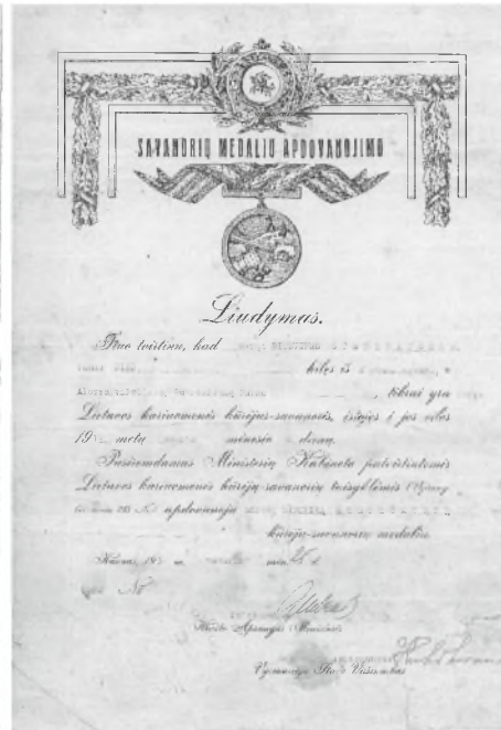
Liudymas, 1931 m.

Pirmasis karininko A. Juozapavičiaus sprendimas buvo toks: „12 vasario 1919 m. Alytus. 2 bataliono vadui. Paliepimas. Rytų 13 vasario 8 val. ryto 5 kuopa turi išeiti užėmimui fronto nuo kaimo Tokmiance ligi kaimo Vedukšty; šie kaimai į šiaurę-rytų pusę nuo Alytaus. 5 kuopa turi būti 10 valandoje kaimo Voidagi. 10 valandoje ryto kaimo Voidagi būsiu ir aš ir smulkiai nurodysiu, kaip užimti frontą. Vienas būrys 6-os kuopos 10 valandoje turi užimti kaimą Uliški, kuris yra į rytus nuo Alytaus; šiam būriui į kaimą