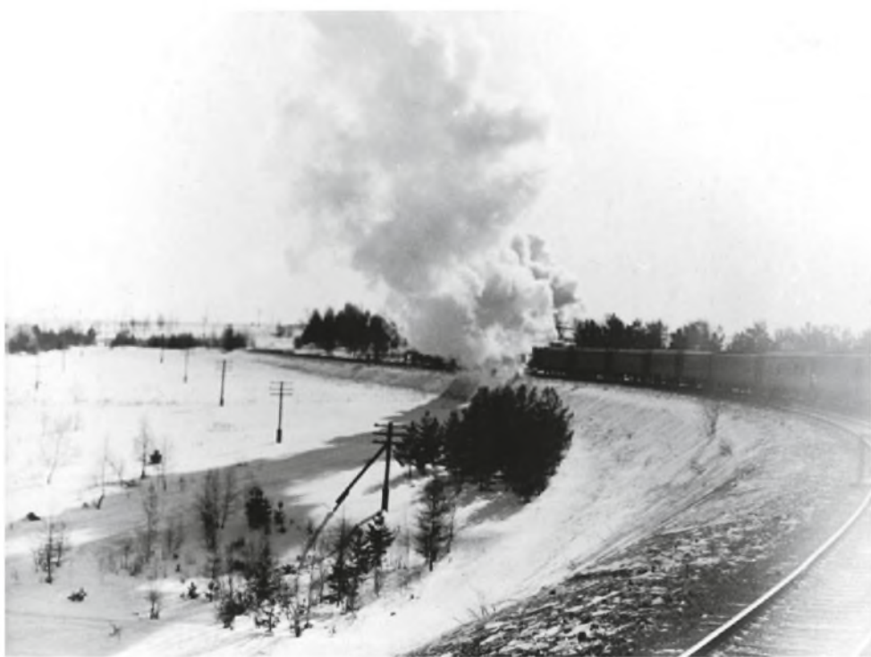
Geležinkelio per Krasnojarsko krašto taigą.