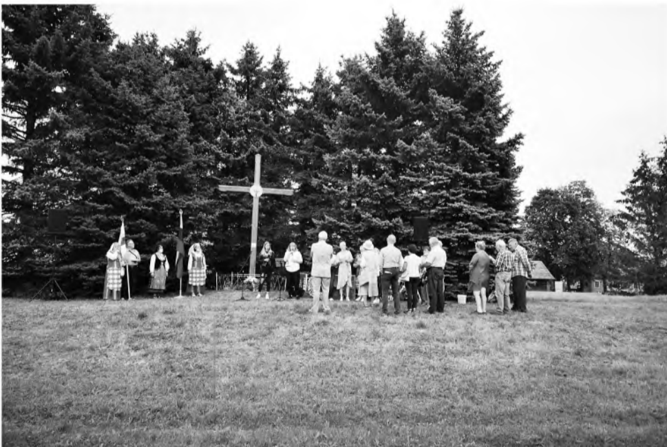
Baltijos kelio minėjimas prie kryžiaus Jonavoje