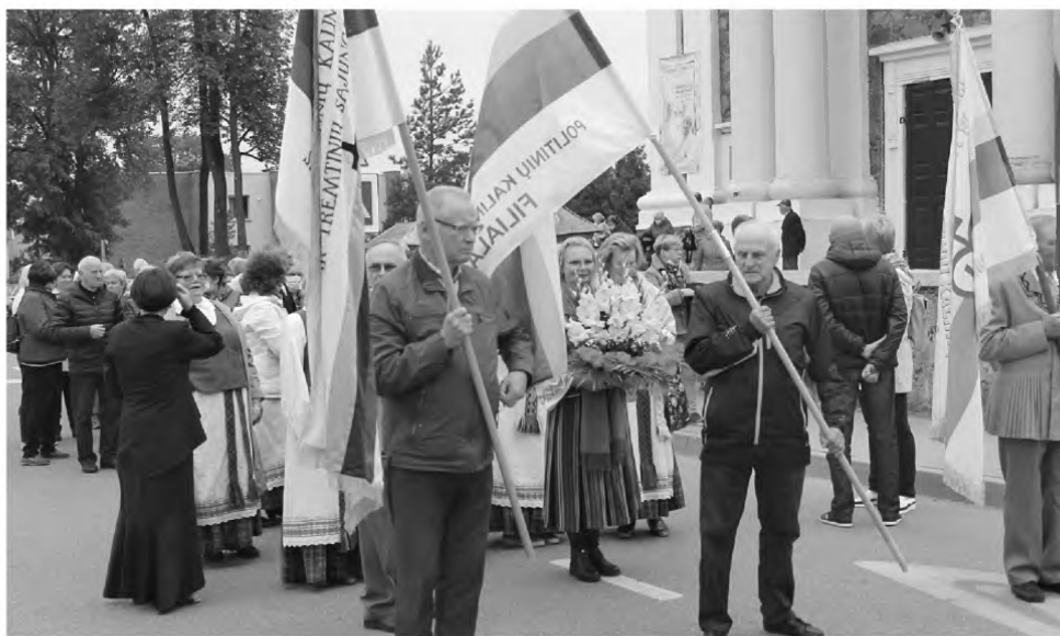
Didelė kolona ukmergiškių ir svečių pajudėjo nuo bažnyčios Daržų gatvės link