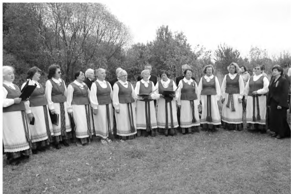
Choro atliekamas dainas dainavo visi