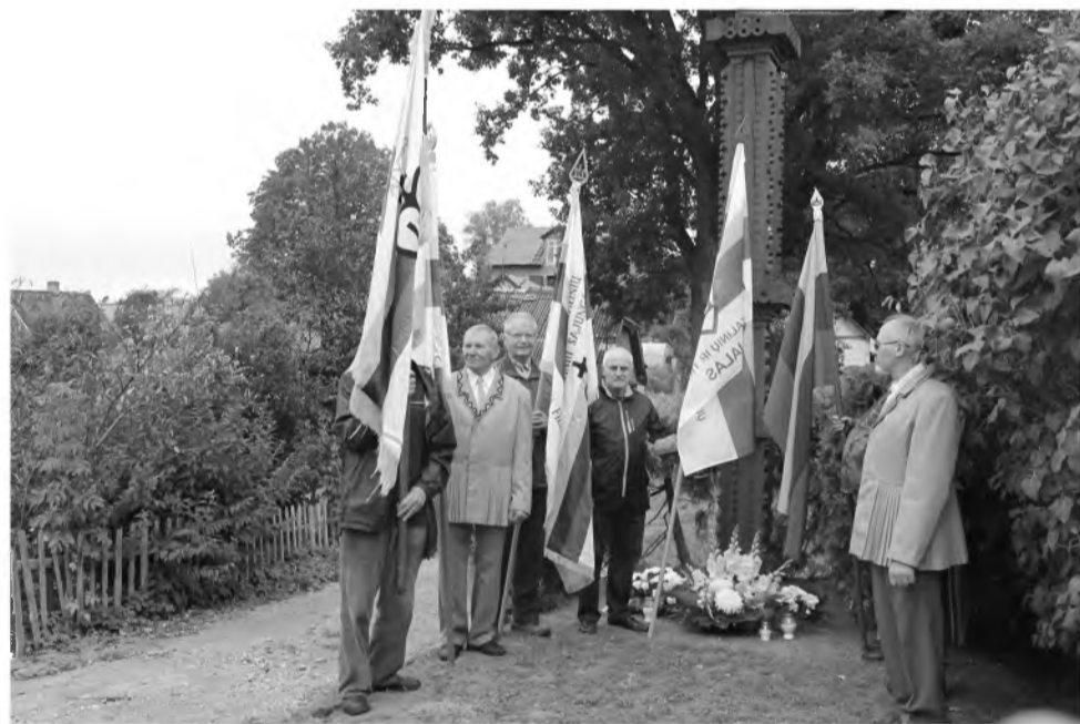
Prie Atminimo kryžiaus žuvusiems partizanams