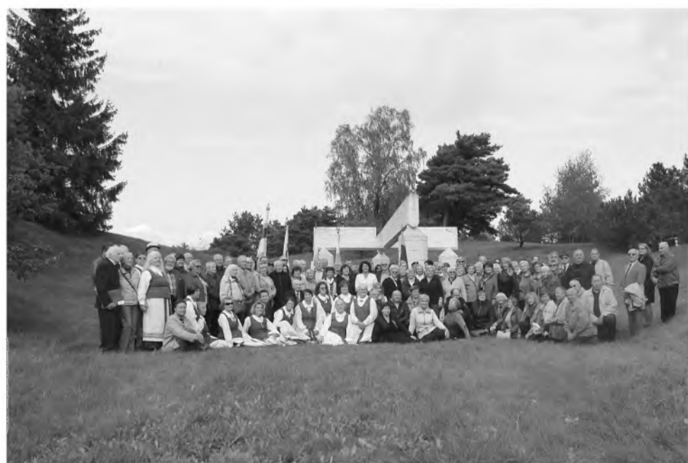
Traktoriai savo vikšrais lygino ir traiškė čia užkastus žmonių kaulus. Želva