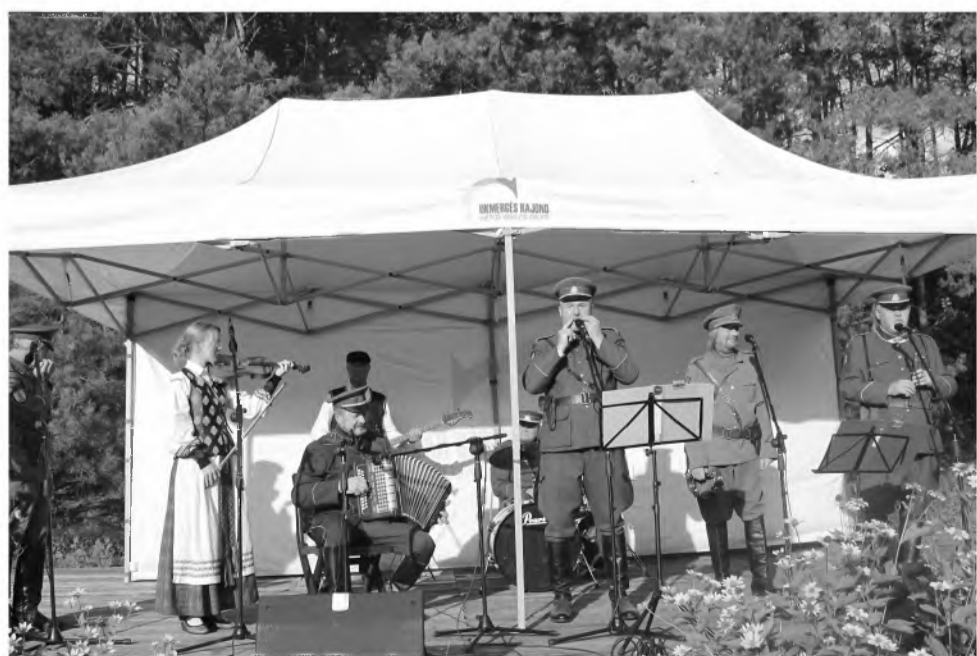
Siesikų kapelijos „Vieversas“ vyrai džiugino dainomis