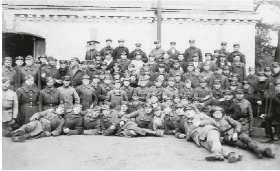
1-o pėstininkų pulko kariai Alytuje, 1919 m. kovo mėnesį