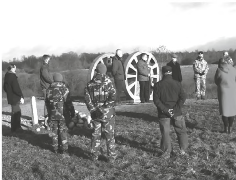
Minint istorinių įvykių šimtmetį, paminklas atidengtas istorinėje Giedraičių mūšio vietoje

Rudenį šventėme vienos svarbiausių pergalių Lietuvos istorijoje šimtmetį ir atidavėme pagarbos duoklę Lietuvos didvyriams, liejusiems kraują už mūsų laisvę.