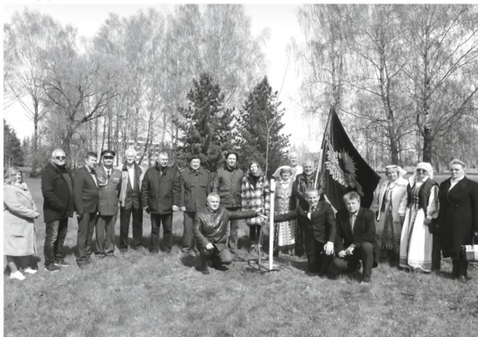
Lietuvai pagražinti draugijos 100-mečio ąžuolyne Lietuvai minėjimo dalyviai

Gegužės 1 d. Kupiškyje vyko iškilmingas Lietuvai pagražinti draugijos 100-mečio minėjimas, buvo sodinami ąžuoliukai. LR Seimas, atsižvelgdamas į tai, kad šiais metais sukanka 100 metų nuo draugijos įkūrimo, vertindamas tai, kad draugija telkė visuomenę, ugdė pilietiškumą ir patriotizmą, įvairiais būdais gražino Lietuvą, siekdamas paminėti draugijos 100 metų jubiliejų, šiuos metus paskelbė Lietuvai pagražinti draugijos metais.