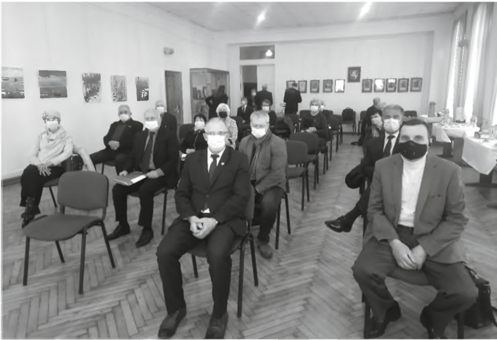
LPKTS valdybos nariai susitiko po daugiau kaip pusmečio