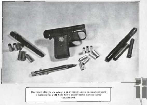
Пистолет «Валда» и оружие в виде отвертки в автоматической с паронимом, сверлящими различными техническими предметами.

Antra, ne ką mažiau svarbi sovietų saugumo užduotis, buvo kova su užsienio žvalgybų veikla Sovietų sąjungos viduje. Už kontržvalgybą