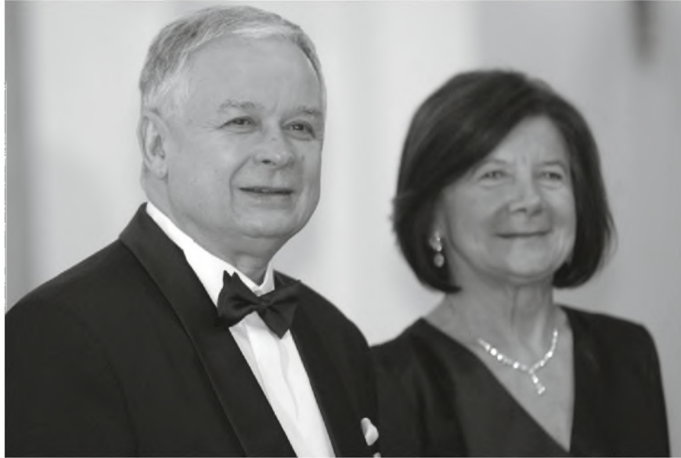
Lechas Kačinskis su žmona Maria Kačinska, 2010 m. balandžio 8 d.

Rusijai okupuojant bet kurią šalį. Ir Rusijos Federacijos Generalinė prokuratūra patvirtino, kad už žudynes Katynėje yra atsakingi sovietai. Tik po lėktuvo aviakatastrofos 2010 m. Maskva perdavė Lenkijai dokumentus su buvusiais 1940 m. balandžio–gegužės mėn. įvykiais Katynėje ir kitur. Perduoti dokumentai liudija, kad Katynės nusikaltimas buvo vykdomas Stalino ir kitų sovietinių vadovų nurodymu.