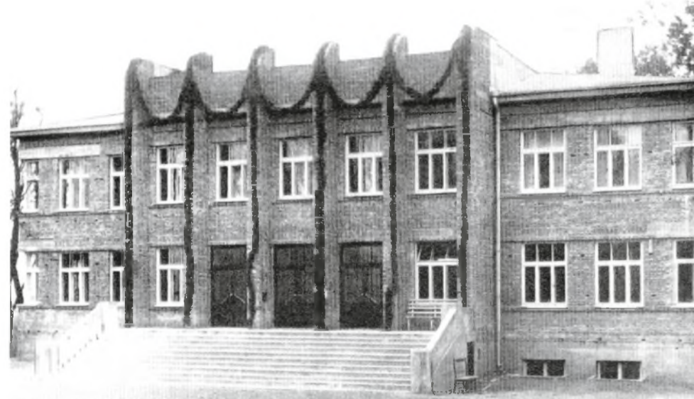
Lietuvos šaulių sąjungos Tauragės rinktinės rūmai 1935 m.