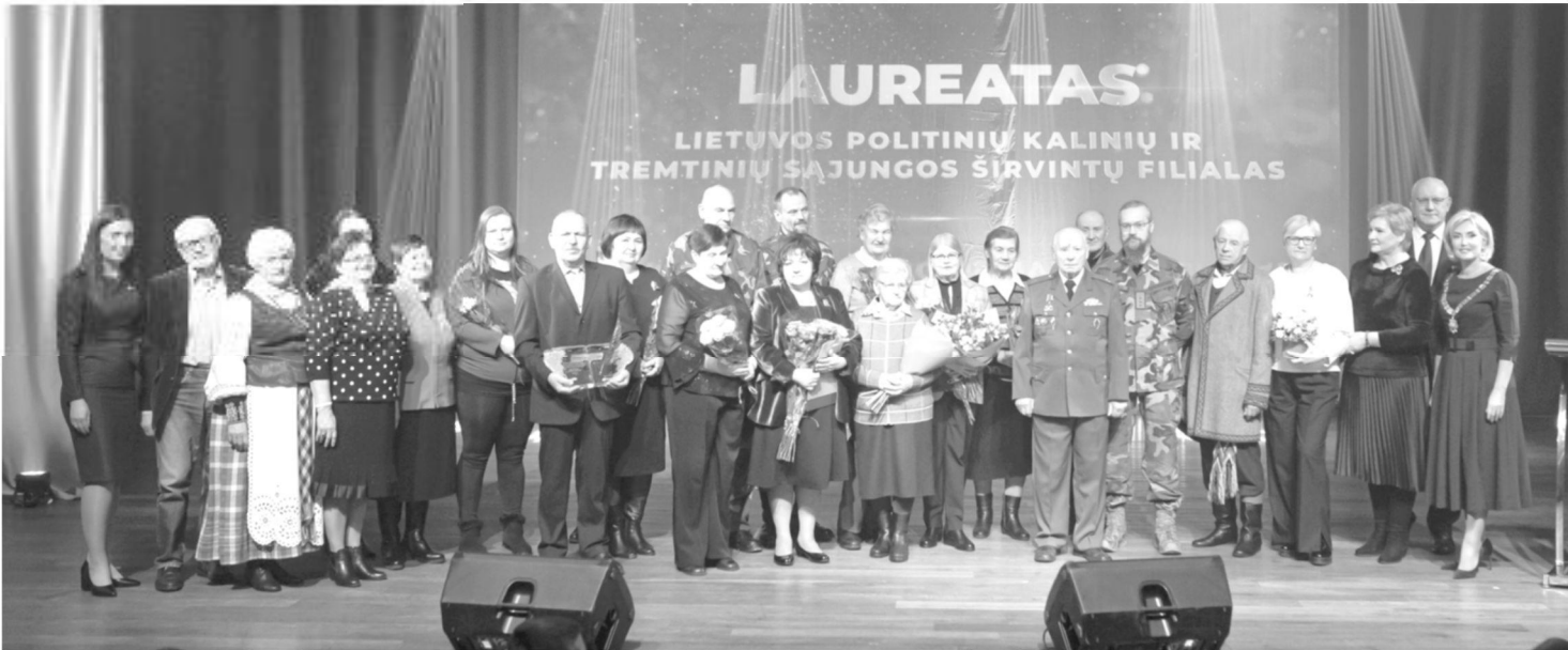
Laureatai širvintiškiai su svečiais iš Ukmergės filialo ir miesto vadovais