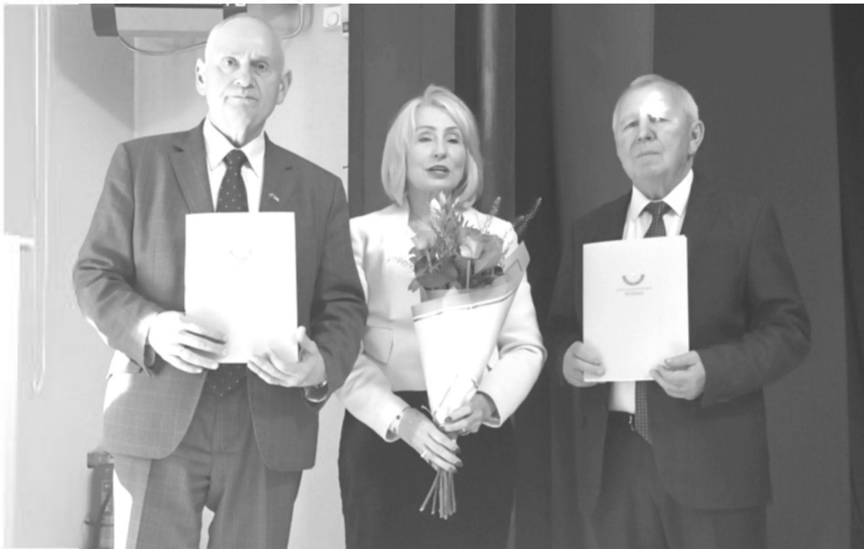
Sveikinimo žodžius sako Seimo narė Angelė Jakavonytė