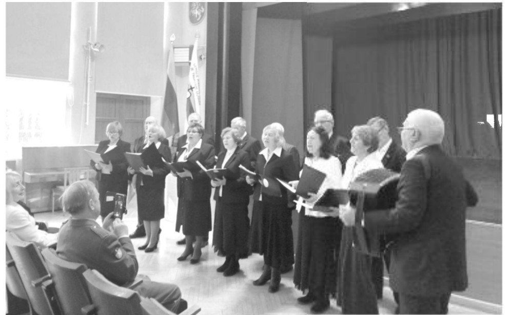
Koncertuoja choras „Atmintis“