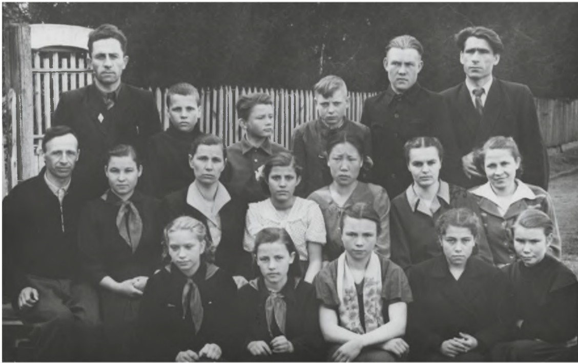
7 klasės baigimo proga direktorius, mokytoja ir mokiniai. 1958 metai

globojo kaimynai. Atrodė, kad jau bus viskas gerai, bet viena nelaimė nevaikšto. Mama susirgo gelta, ir vėl į ligoninę. Po kurio laiko pasveiko ir grįžo pas vaikus. Vėl šeimos rūpes- čiai ir kolūkio darbai. Ačiū Dievui, kad šalia buvo gerų žmonių.