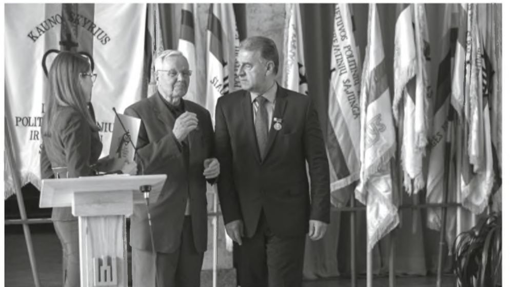
LPKTS XXVI suvažiavime Kauno karininkų ramovėje. 2019 metai