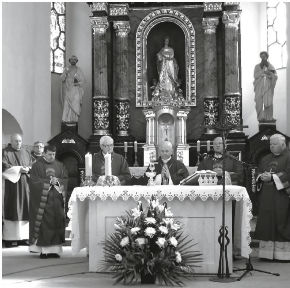
Šv. Mišias aukėjo kardinolas Sigitas Tamkevičius