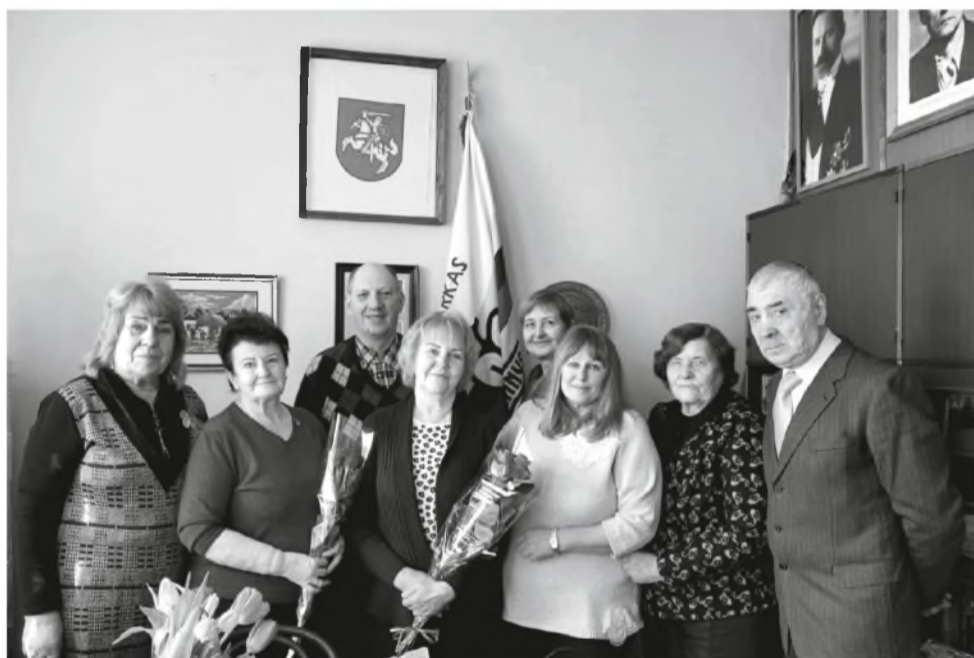
LPKTS Jurbarko filialo aktyvas

Lietuva ir Ukraina – šiandien svarbiausi žodžiai. Posėdyje skambėjo abiejų šalių himnai ir dainos, kraštiečių prisiminimai dienoraštyje, eilės ir ašaros, virpuly balse. Džiū-