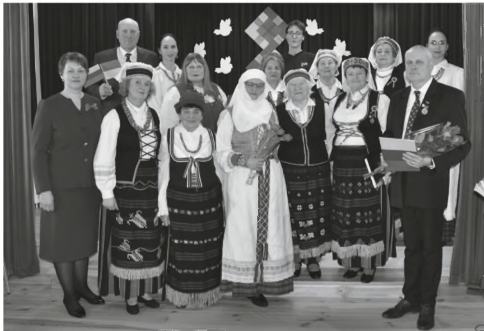
Daug gražių koncertų surengia ansamblis „Versmelė“