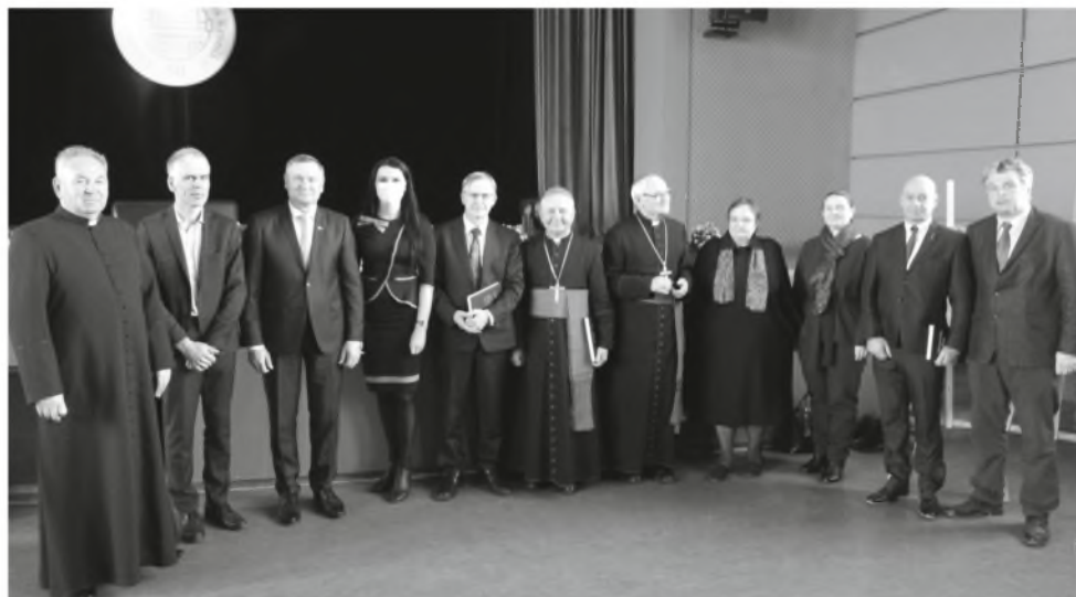
Iškilmingo minėjimo svečiai Simne