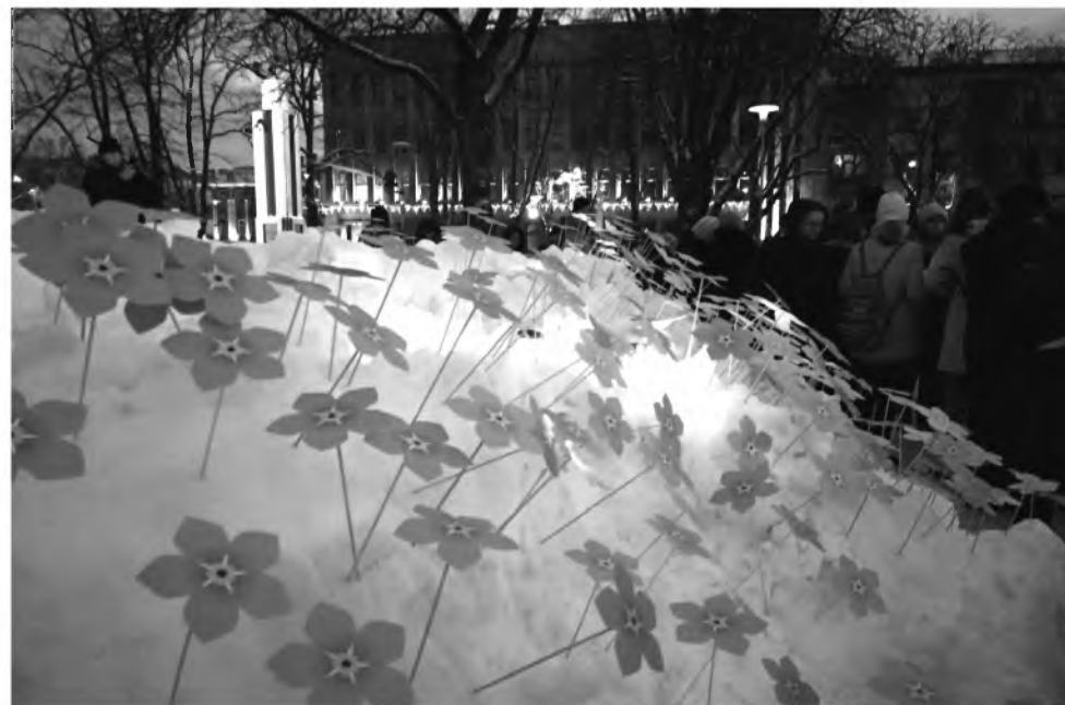
Sausio 13-osios išvakarėse Karo muziejaus sodelis pražysta Neužmirštuolėmis