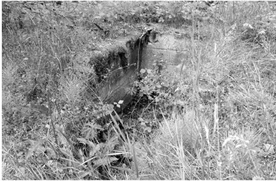
Išlikę betoniniai postų įtvirtinimai-apkasai kairiajame Nemuno krante, ties tiltu

„Dar ne visi buvome pavalgę, kai išgirdome kulkosvaidžių kalenimą prie Merkinės. Buvo aišku, kad kautynės prasidėjo. Skubiai šokome prie malūno,