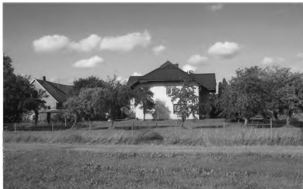
Bendras tvarkingos sodybos vaizdas