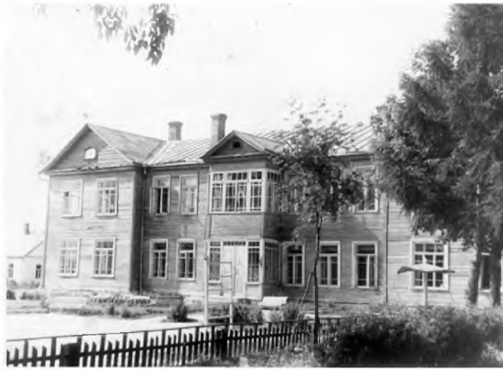
Rokiškio geležinkelio stoties pradinė mokykla. 1930 m.

– Rokiškio geležinkelio stoties pradžios mokyklos vedėjas Tilindis, – at-