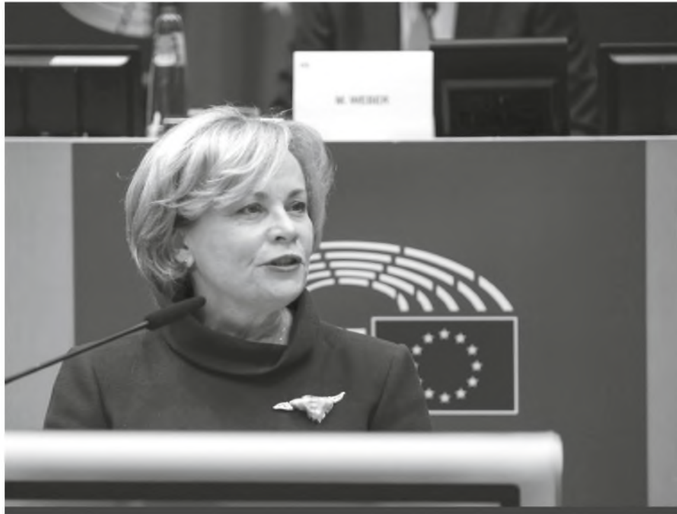
Europarlamentarė Rasa Juknevičienė

Vertinama, kad Gulago kalinių skaičius siekė apie 15–18 mln. žmo-