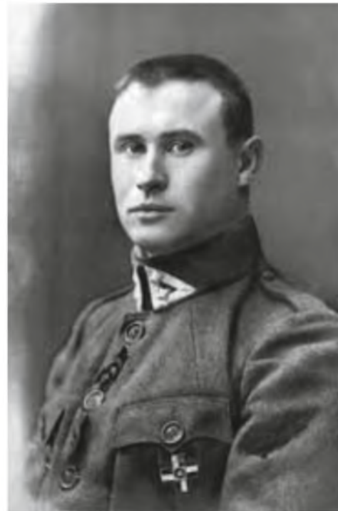
Generolas Kazys Ladiga

Būsimasis Lietuvos kariuomenės savanoris, Nepriklausomybės kovų karvedys Kazys Ladiga gimė 1893 m. gruodžio 25 d. Iškonyse (Biržų aps. ir valsč.), pasiturinčių ūkininkų šeimoje, todėl turėjo galimybę mokytis. Kazys baigęs Biržų pradinę mokyklą, vėliau tęsė mokslus privačioje Pav-