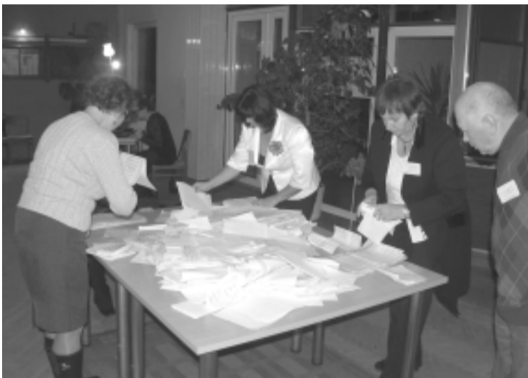
Skaičiuojami rinkimų balsai