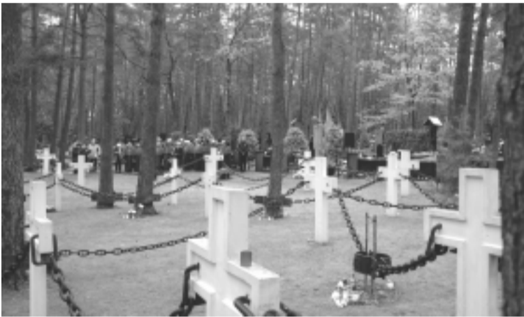
Mirusiųjų atminimo dieną prie Petrašiūnų kapinių „Tautos kančios“ memorialo