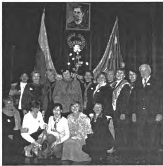
Varpininkų draugijos nariai, kudirkaičių vadovai ir svečiai Vinco Kudirkos vid. mokykloje

durinių mokyklų, Juozo Lukšos gimnazijos davė pirmąją savo gyvenime priesaiką, pagerbė Lietuvos valstybinę vėliavą ir įsiliejo į Lietuvos kudirkaičių gretas. Jaunuosius kudirkaičius pasveikino