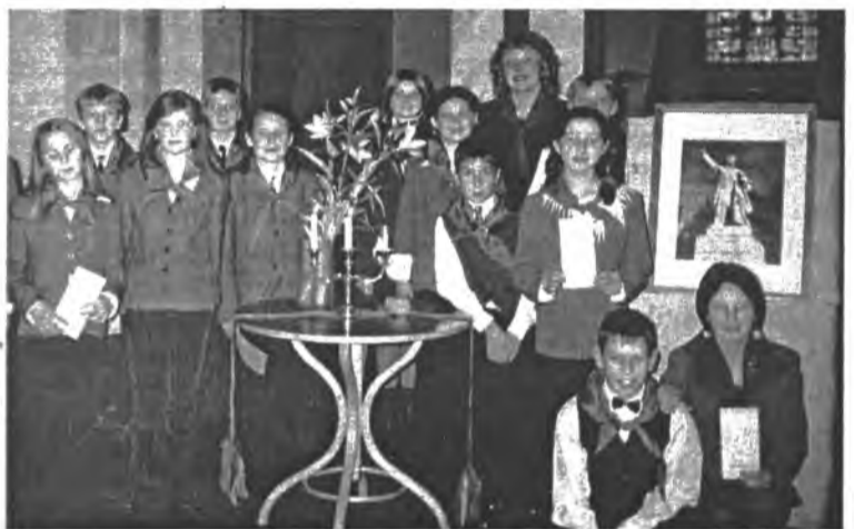
Jaunieji kudirkaičiai pirmosios priesaikos metu

įvykusia Vinco Kudirkos vidurinėje mokykloje.