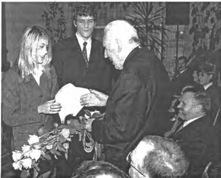
Įteikiamos dovanos