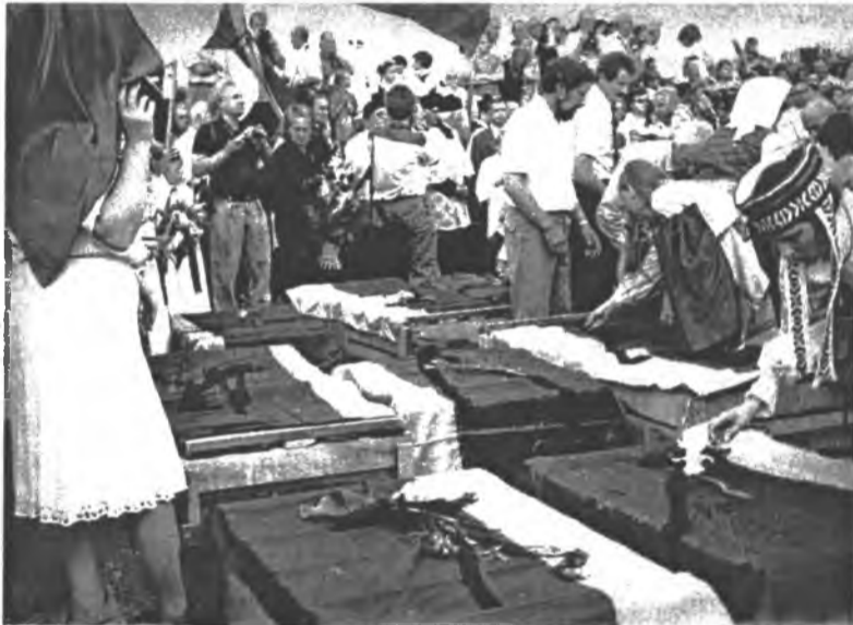
Pirmosios ekspedicijos iš Igarkos atvežti palaikai Kėdainių aerouoste

kapų. Iš 16 atvykusių buvu- sių igarkiečių savo artimųjų palaikus surado tik 12. Nera- do kapų ir tie, kurių artimieji buvo palaidoti naujosiose, t.y antrosiose, kapinėse. Jų ka- pai nežinomi, nes po 1962 m. vasarą Igarkoje kilusio gais- ro šių kapinių vietoje, kur bu- vo palaidotas ir mano tėvelis, buvo nutarta statyti naują mikrorajoną, todėl kapinės buvo panaikintos. Vietiniai Igarkos gyventojai savo arti- mųjų palaikus persikėlė į nau- jiasias kapines (trečiąsias), o