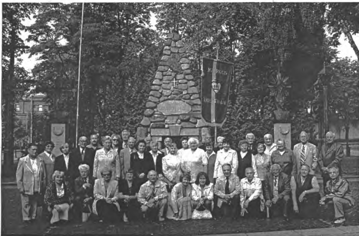
Pirmosios ekspedicijos į Igarką abiejų grupių dalis dalyvių po 15 m. Kaune, prie paminklo "Žuvusiems už Lietuvos laisvę"

Šios ekspedicijos tikslas buvo fotografijos ir dokumentinio kino filmo priemonėmis parodyti, kaip gyvena ir dirba ten dar esantys lietuviai, taip pat užfiksuoti lietuvių kapinių apgailėtiną būklę. Šios ekspedicijos metu buvo sukurtas L.Pangonytės ir