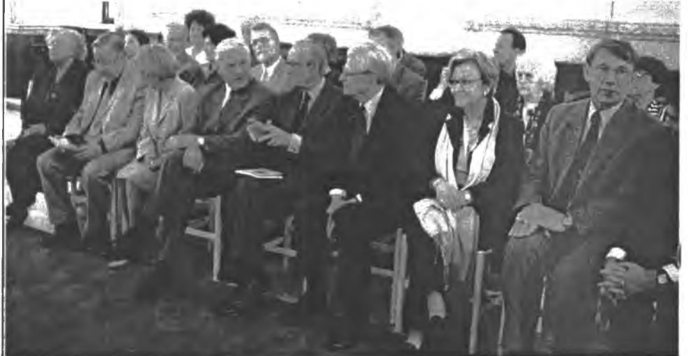
Minėjimo dalyviai Kauno rotušėje