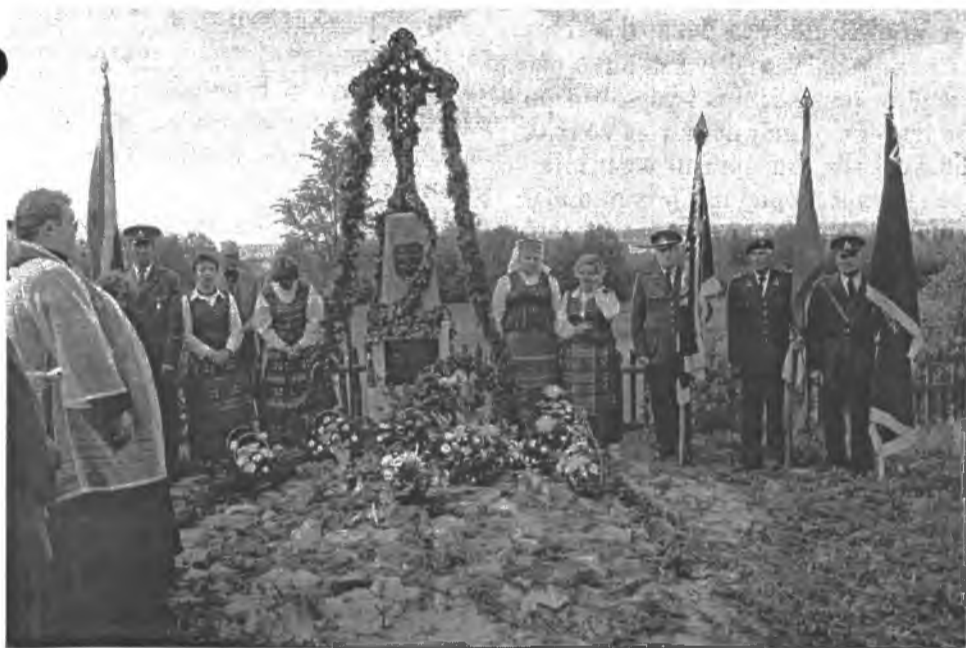
Amalviškių kapinaitėse švenčinamas paminklas partizanams.

31-osios naktis buvo tyli, virš ežero kilo ir draikėsi rūkas. Sūnus ir Karaliūnas yrėsi valtimi į kitą Amalviškių ežero krantą susitikti su Kolumbu. Gegužės nakties vėsa gaivino vyrus, retkarčiais tylutėliai supliuškendavo nuo irklavimo vanduo. Karaliūnas dairėsi, klausėsi. Vos jų kojos pasiekė kranto žemę, staiga priekyje pasirodė šešėliai ir pasigirdo šūviai. Už Karaliūno eidamas sudejavo Sūnus ir amžiams sukniubo. Karaliūnas, jaunas, stiprus, nepasidavė - šaudė.