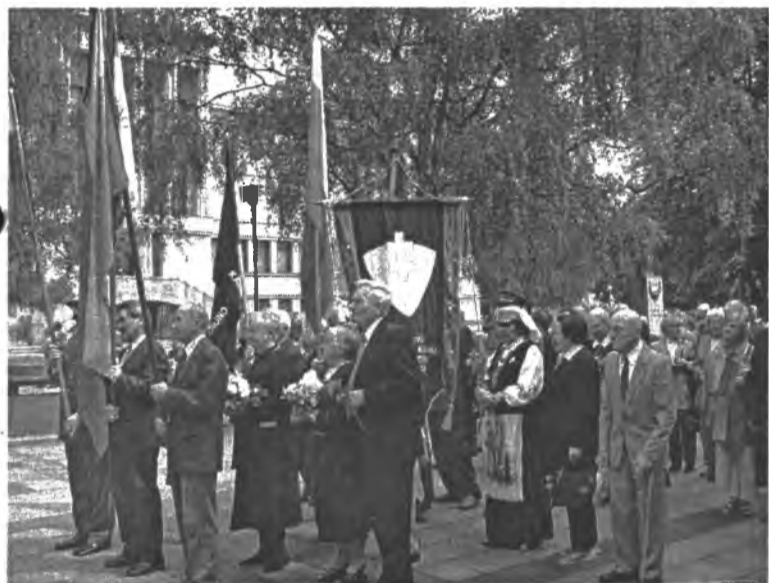
Kauniečiai ir miesto savivaldybės atstovai prie Nežinomojo kareivio kapo

ragino valdžią ryžtingiau derėtis su Maskva dėl okupacijos žalos atlyginimo. "Žmonės, kurie visą savo sąmoningą gyvenimą kovojo ir kentėjo dėl teisybės ir laisvės, yra nusivylę maty-