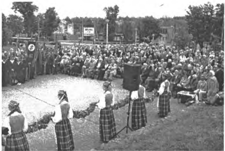
Iškilmų minutė Vilniuje