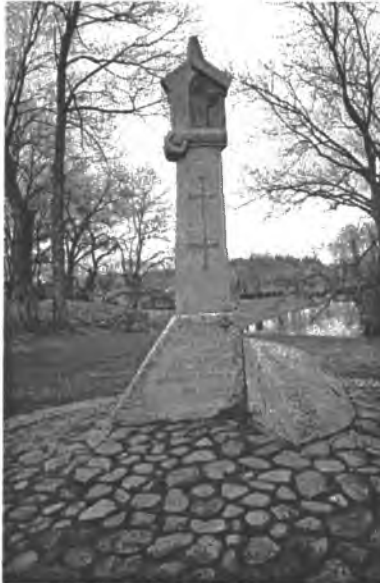
Paminklas Sedoje žuvusiems TAR kariams

Šiauliuose mus pasitiko LVRKS apskrities skyriaus nariai su savo ir valstybės vėliavomis. Nuvažiavome prie Kryžių kalno, kur plechavi-