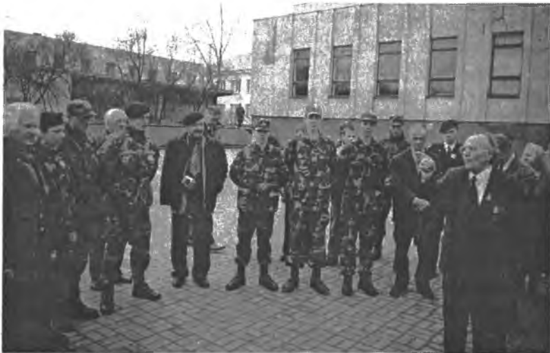
Žygio dalyvių sutikimas Skuode

bei partizanus. Pasikeitę atminimo dovanėlėmis – spaudos leidiniais bei vizitinėmis kortelėmis, atsisveikinome su maloniai mus priėmusiais skuodiškiais ir išvykome į Sedą pagerbti ten sudėtų Tėvynės apsaugos rinktinės karių aukų – Sedos kautynėse 1944 m. spalio 7 d. žuvusių savanorių. Miestelio centre pastatytas paminklas, primenantis tas žiaurias kautynes. Prie jo giedojome „Marija, Marija“ ir Lietuvos himną.