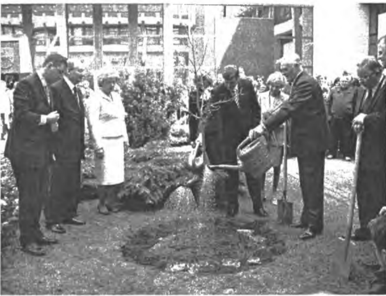
Ažuolėlio sodinimas Seimo kiemelyje, Vilniuje