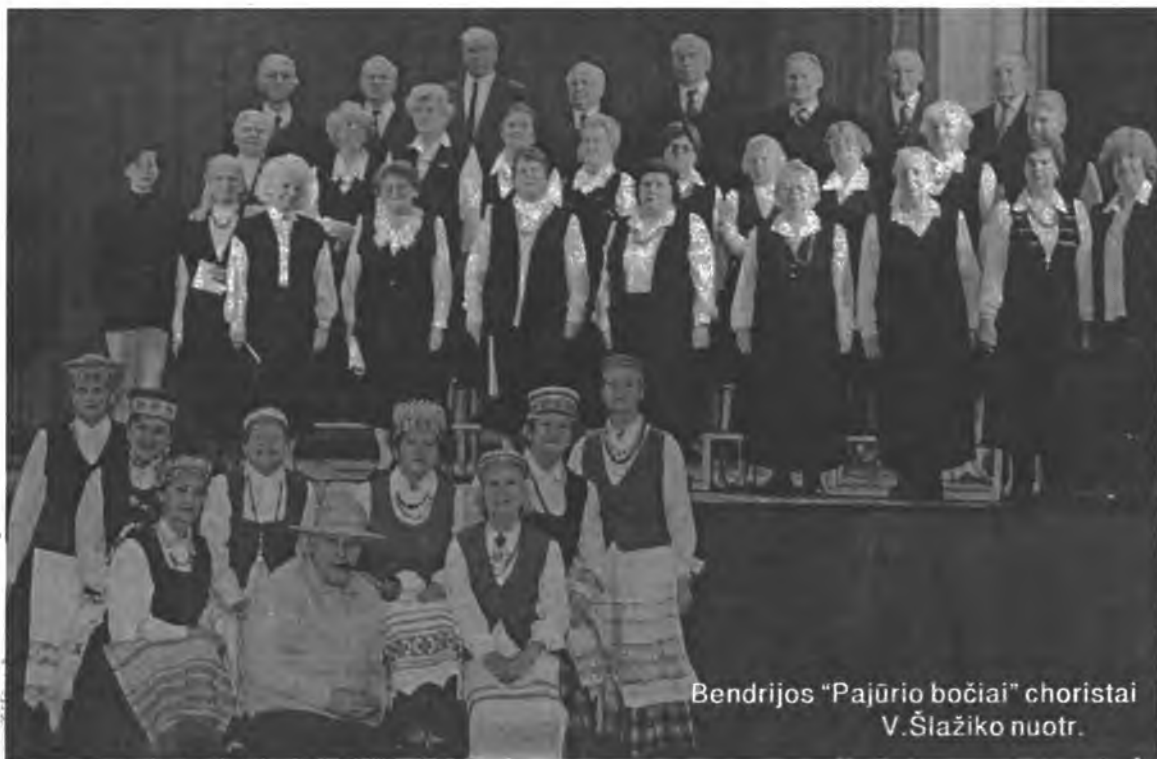
Bendrijos "Pajūrio bočiai" choristai

leviziją, skaitys laikraščius. Štai kur šios pensininkų bendrijos traukos paslaptis - švietėjiška veikla, skatinanti domėtis, mokytis ir mąstyti.