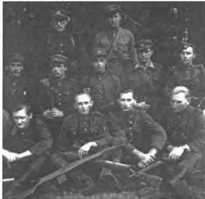
A. Ramanauskas-Vanagas su kovos draugais

Tokių barbariškų kankinimų, apie kuriuos liudija Lietuvos ypatingajame archyve saugomi dokumentai, nėra buvę nuo Europoje siautėjusios inkvizicijos laikų. A. Ramanauskas buvo kankinamas fiziškai ir morališkai beveik metus. 1957 m. rugsėjo 24–25 d. Vilniuje posėdžiavęs LSSR Aukščiausiasis Teismas jam skyrė mirties bausmę. Nuosprendis įvykdytas tų pačių metų lapkričio 29 d. Vilniuje. Palaidojimo vieta nežinoma.