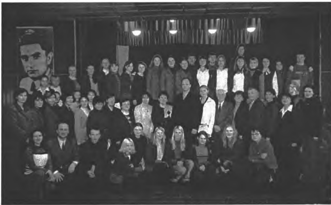
Konferencijos "Tremties ir rezistencijos atspindžiai lietuvių tautos sąmonėje" dalyviai

Sausio 13 d. Garliavos Juozo Lukšos gimnazijoje vyko Kauno rajono moksleivių konferencija "Tremties ir rezistencijos atspindžiai lietuvių tautos sąmonėje", skirta Laisvės gynėjų dienai paminėti.