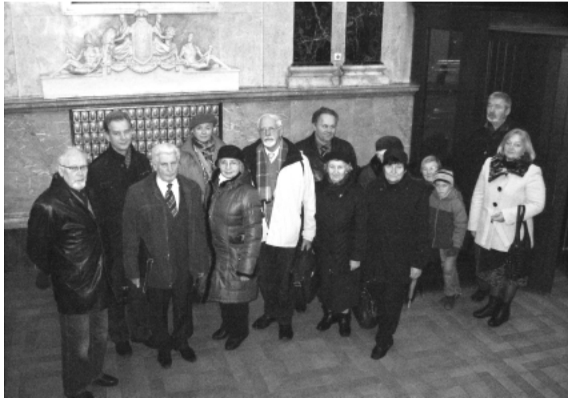
Ekskursijos dalyviai senojo Lietuvos banko vestibulyje