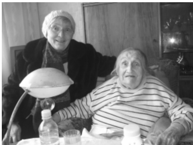
Lietuvos politinių kalinių ir tremtinių sąjungos Klaipėdos rajono filialo nariai aplankė likimo draugus