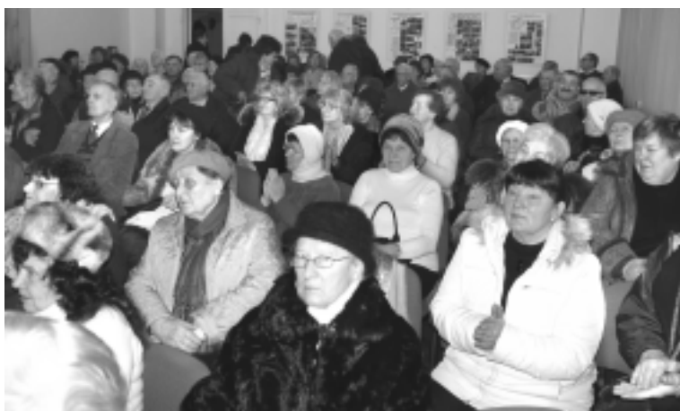
LPKTS Kauno filialo nariai gausiai susirinko į konferenciją