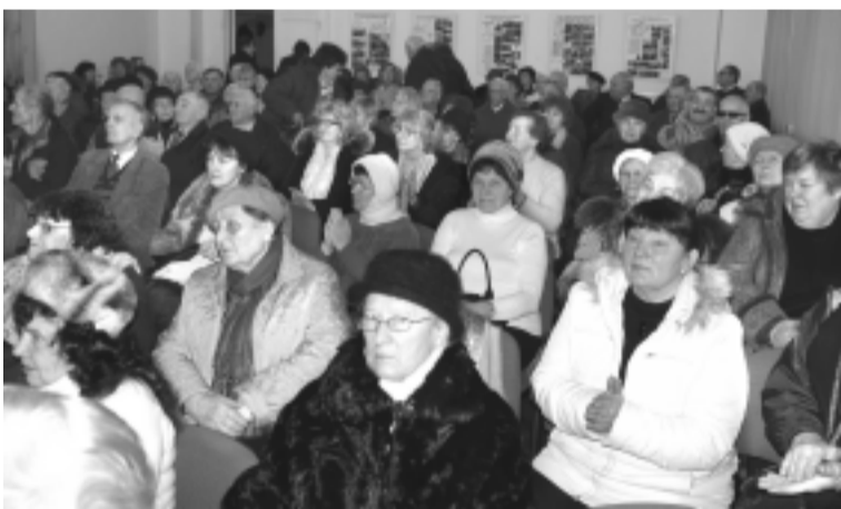
LPKTS Kauno filialo nariai gausiai susirinko į konferenciją