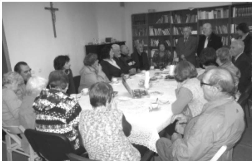
Susitikime su Jakutske gyvenančiais tautiečiais, buvusiais tremtiniais

Mongolijoje, nuo 2009 metų dirba Jakutske.