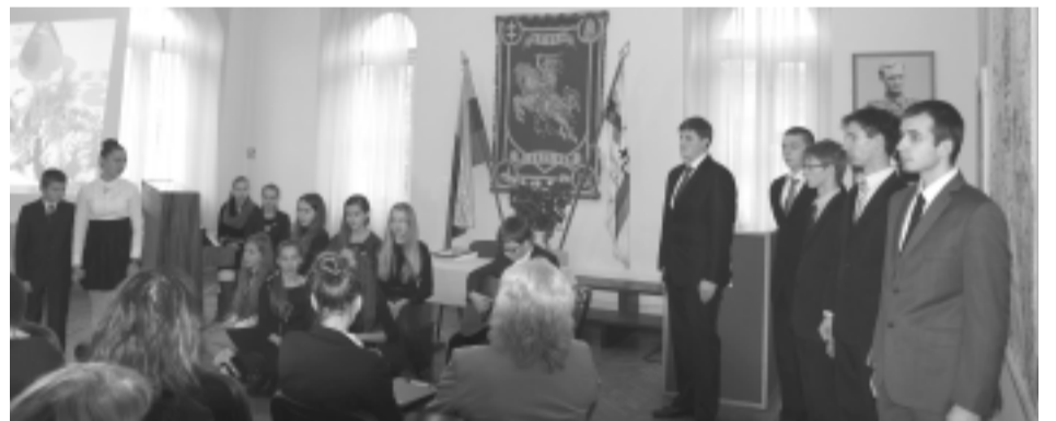
Išpūdžiais dalijosi Kauno mokyklų moksleiviai