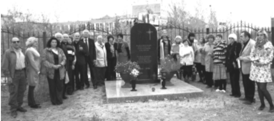
Prie paminklo Jakutijos žemėje žuvusiems ir mirusiems lietuviams atminti. Kristaus Tiesos bažnyčios šventoriuje