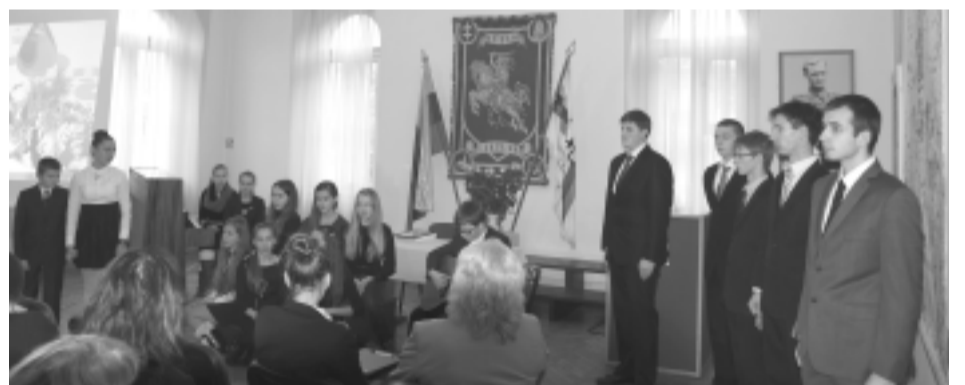
Išpūdžiais dalijosi Kauno mokyklų moksleiviai