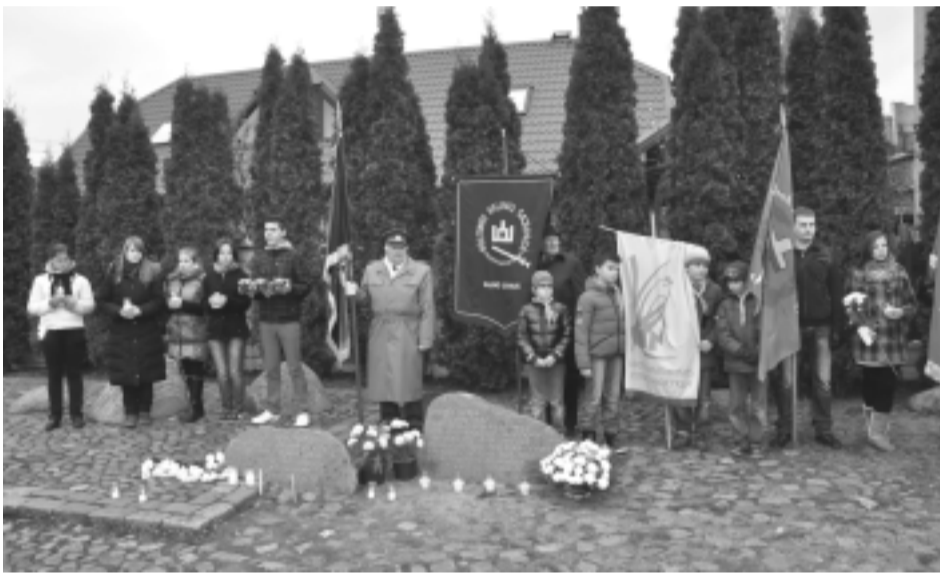
Prie paminklo Tauro apygardos Birutės rinktinės partizanams