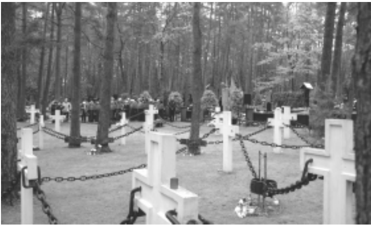
Mirusiųjų atminimo dieną prie Petrašiūnų kapinių „Tautos kančios“ memorialo