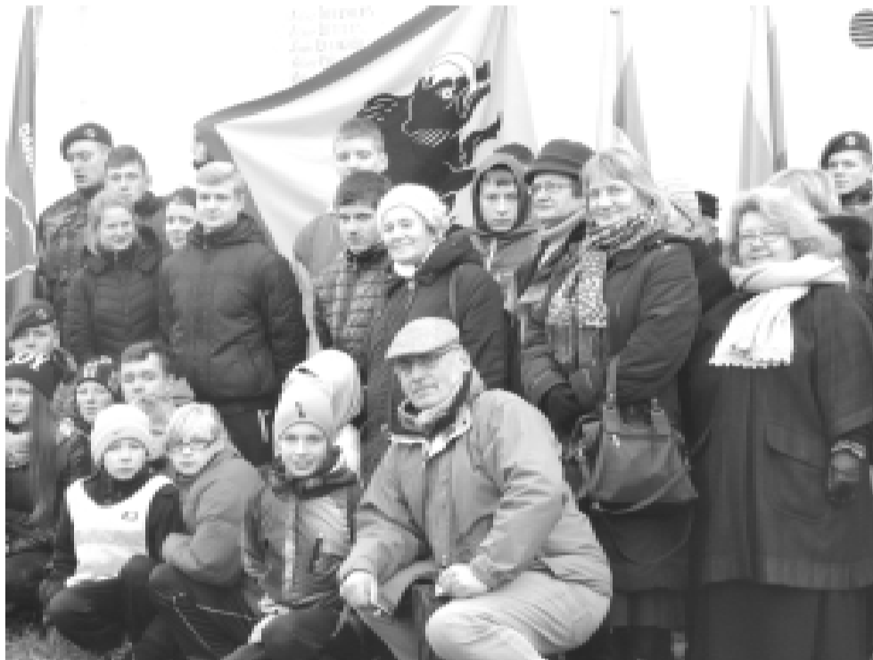
Troškūnų šaulių žūties 95-ųjų metinių paminėjimo dalyviai

Renginį vedęs R. Guobis pasakojo apie tolimus 1918-uosius, kovas už