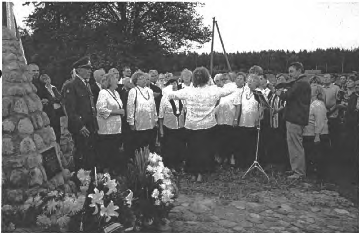
Dainuoja Druskininkų buv. tremtinių choras prie paminklo partizanui V.Barbatavičiui-Bombonešiui