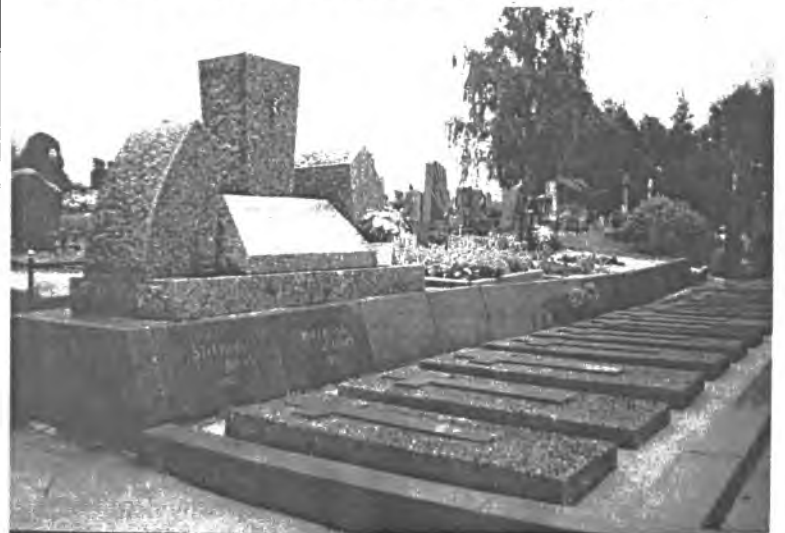
Memorialas Juodupėje žuvusiems partizanams