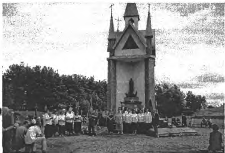
Merkinės kryžių kalnelyje, prie koplyčios, LPKTS Varėnos ir Lazdijų skyrių ansambliai