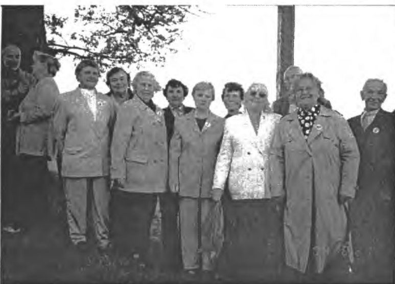
Choras pasiruošęs dainuoti