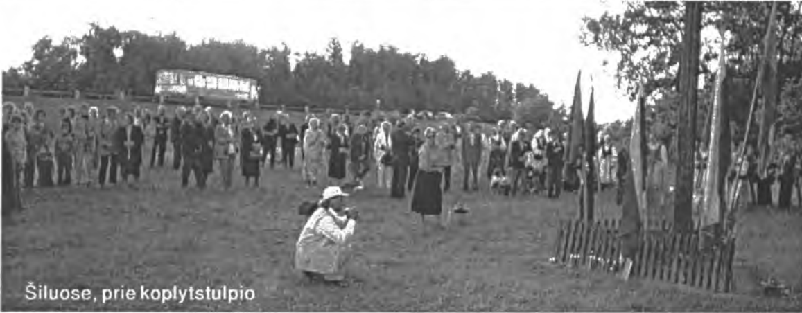
Šiluose, prie koplytstulpio