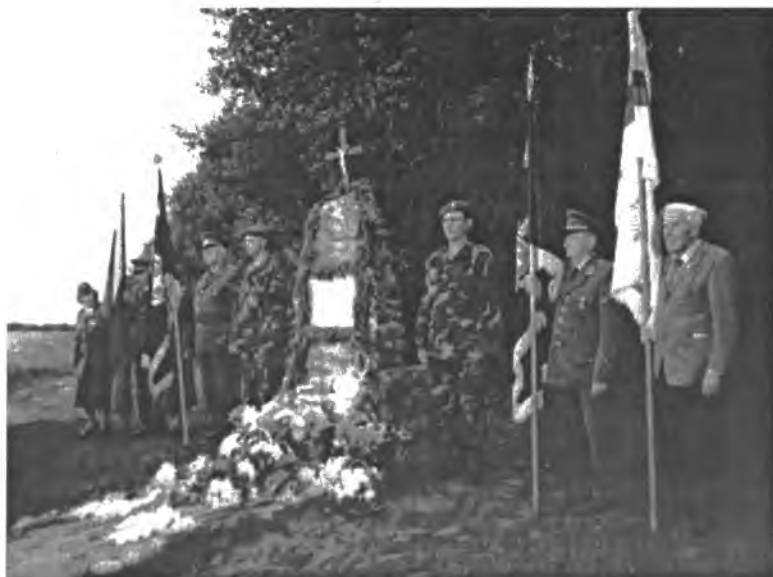
Garbės sargyba prie paminklo

Iš miestelio mašinų kolona pajudėjo prie paminklo partizanams šalia Puožgirio miško. Čia jau laukė Kupiš-