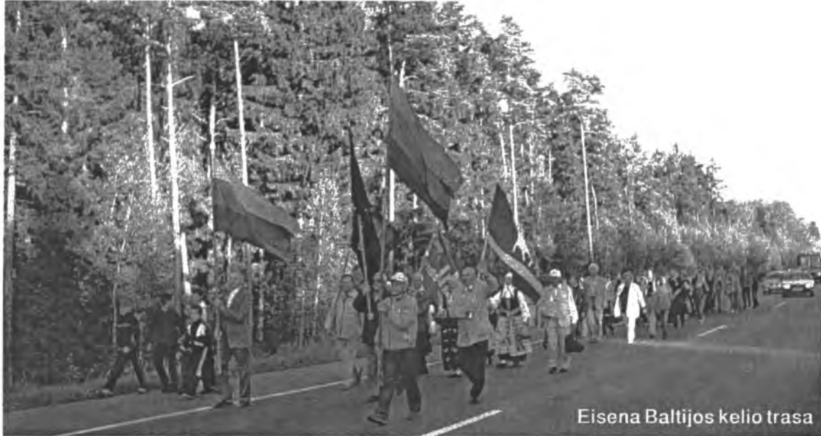
Eisena Baltijos kelio trasa