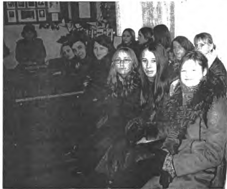
"Atžalyno" gimnazijos gimnazistai Pakruojo sk. būstinėje

Vakare skyriaus nariai dalyvavo Sausio 13-osios minėjime Linku-voje. Mokytojos S.Lovčikaitės vadovaujamas etnografinis kolektyvas buvo paruošęs prasmingą programą, po to prie laužo prisimindami Sausio nakties įvykius simboliškai dalijo- mės, kaip ir anuomet, atsineštomis kukliomis vaisėmis ir arbata. Susiki- bę už rankų dainavome patriotines