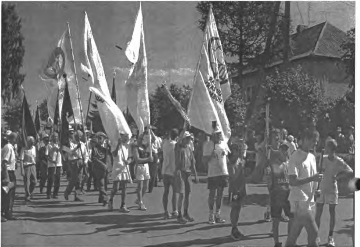
Jaunieji sąskrydžio dalyviai

tos ir išdalytos "ledo gėlės" – iš sidabru žvilgančio metalo pagamintos gėlės: kad širdyse rusenanti meilė Laisvei, Tėvynei ir gimtosios sodybos sode augančiai Obelėlei jas sušildytų ir ištirptų visos nuoskaudos, atgimtų meilės, kūrybos ir bendrumo jausmas. Laikydami rankose "ledo gėles" visi sąskrydžio dalyviai kartu sudainavo "Giminių dainą".