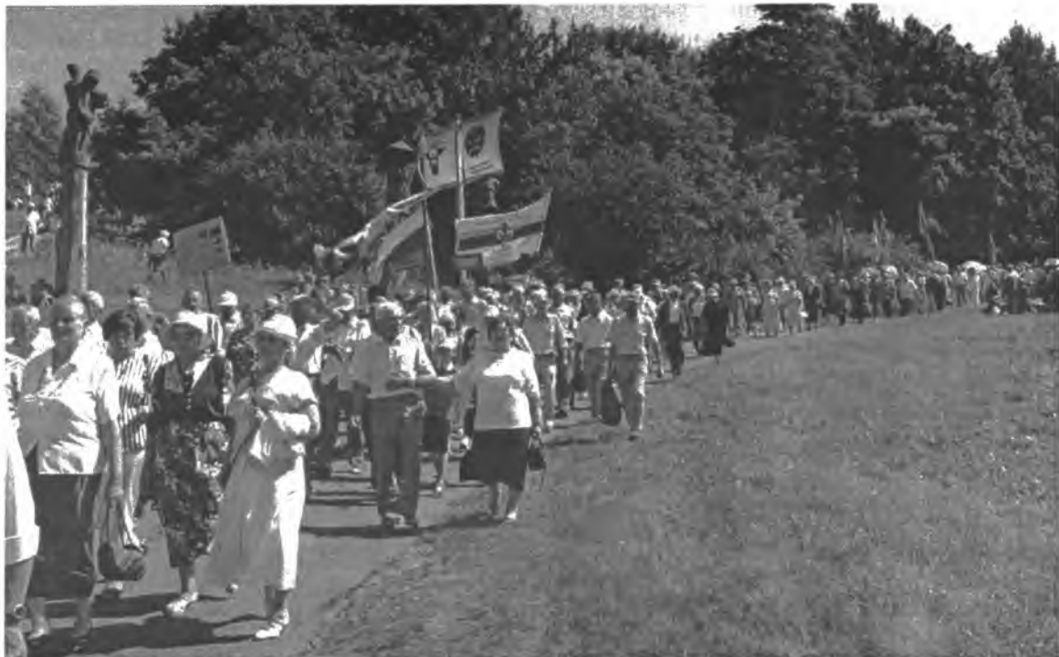
Eisena Dubysos slėnio link