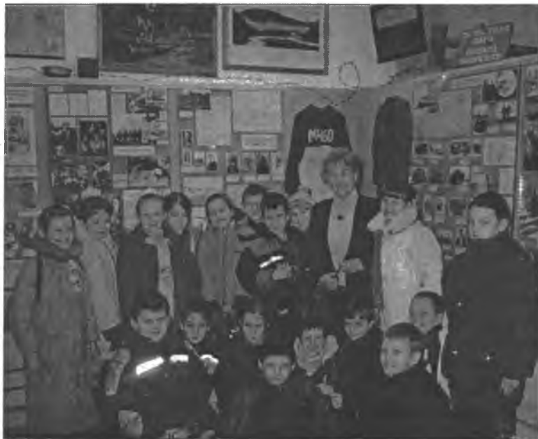
Juozo Grušo vid. mokyklos mokiniai su muziejaus darbuotoja. 2001 01 25