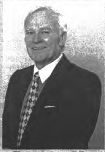
Prof. Vytautas LANDSBERGIS