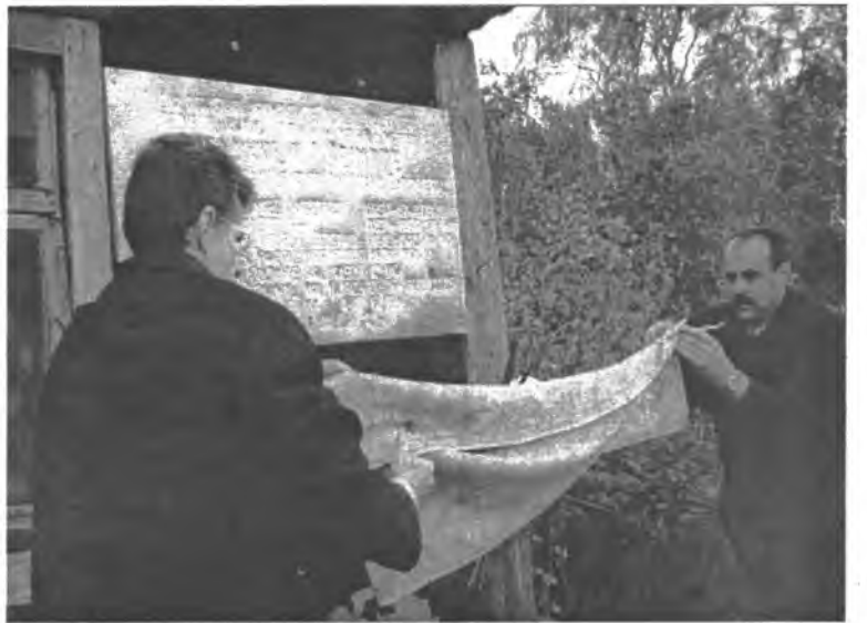
Atidengiama memorialinė lenta