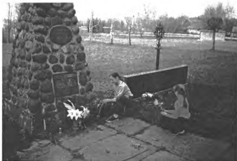
Nevysta gėlės žuvusiųjų atminimui Igliaukoje