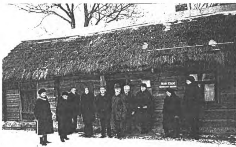
J. Zikaro memorialinio muziejaus kiemelyje