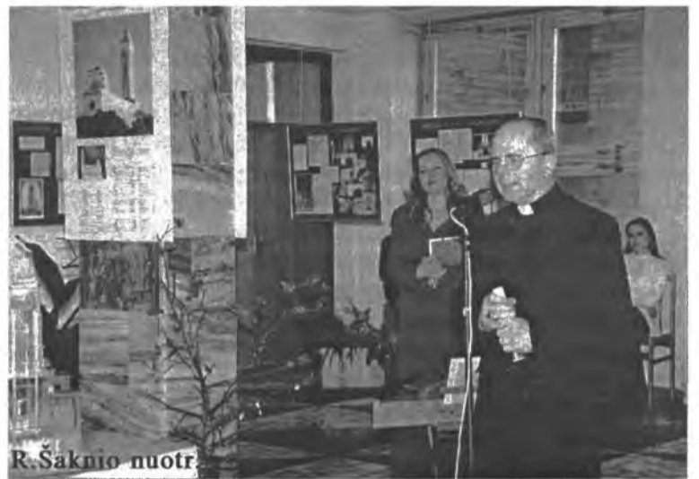
Arkivyskupas S. Tamkevičius nuoširdžiai dėkojo visiems, besirūpinantiems šventovės atstatymu, ir parodos rengėjams