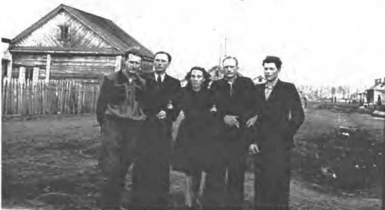
Irkutsko sr. Novostroikos inteligentija. 1952 m.