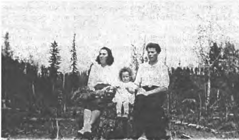
O aplink tik taiga... Irkutskio sritis, Novostroika. 1955 m.