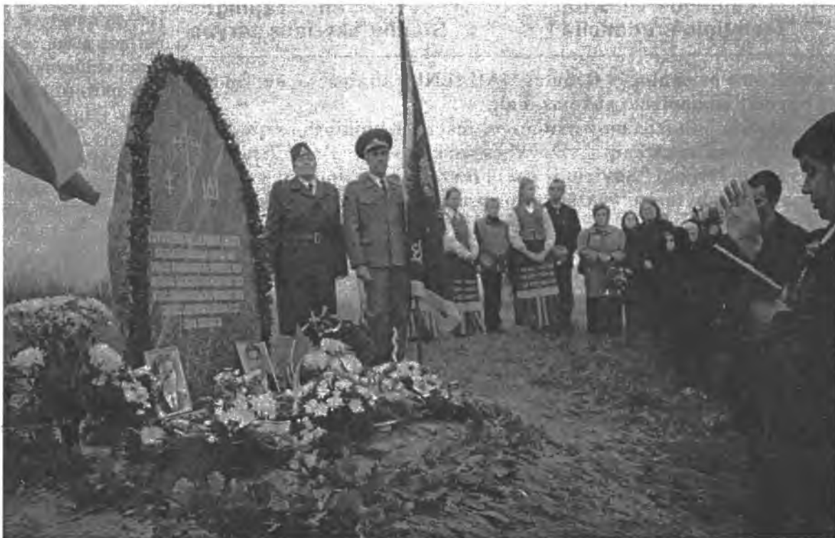
Prie paminklinio akmens žuvusiems partizanams