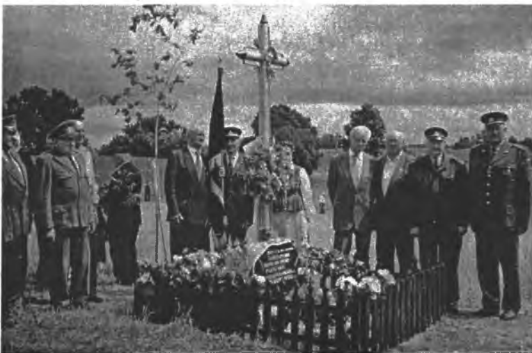
Prie žuvusių partizanų kryžiaus